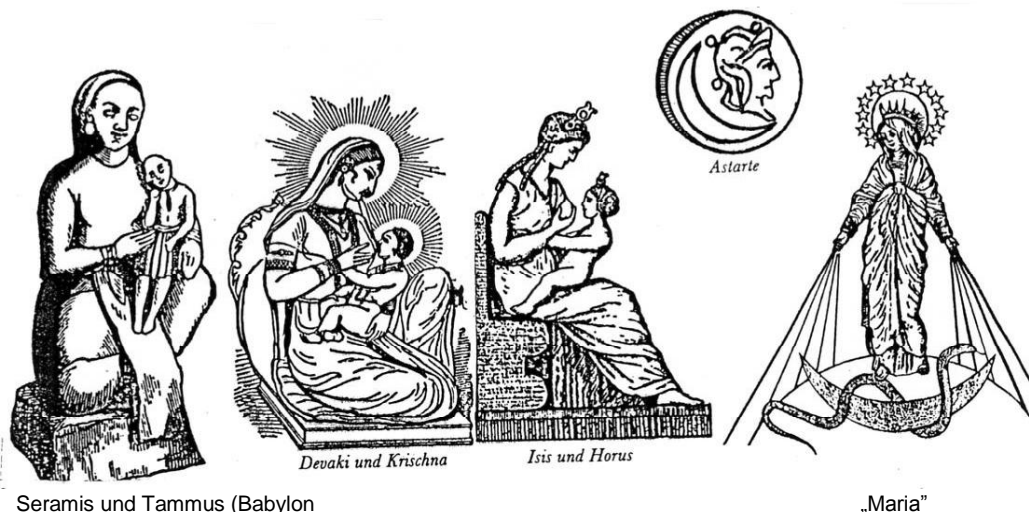
Seramis und Tammus (Babylon)

Die Kinder können schlimmer sein als die Mutter!